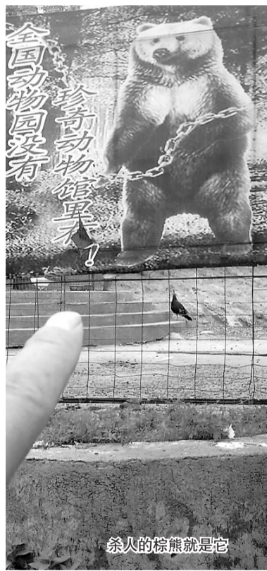
杀人的棕熊就是它