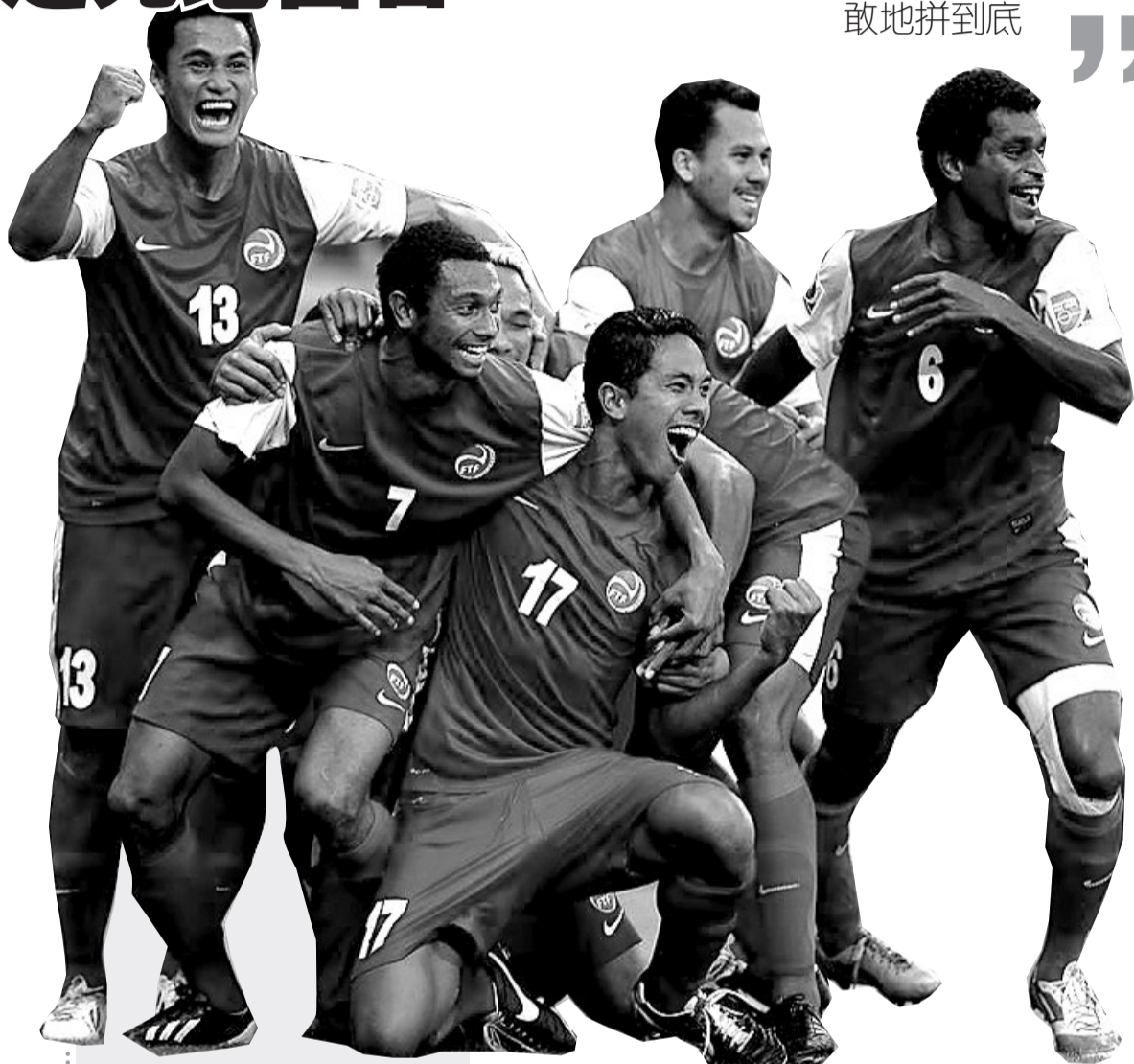
塔希提获历史性进球虽败犹荣

感谢爱到亚洲凑热闹的澳大利亚、大洋洲国家杯阴沟翻船的新西兰,否则我们也许永远也不会有机会在电视里亲眼看到塔希提队踢球。昨晨,全球排名第179名的塔希提亮相联合会杯,虽然1:6落败,不过塔希提赢得了世界足坛的尊重。这是全世界唯一一支参加国际大赛决赛阶段的业余球队,全队仅一名球员靠踢球为生,其他不是码头搬运工就是公司会计,还有四位叫特奥的队友竟然是堂兄弟。塔希提来踢联合会杯,胜负早已不是悬念,无非是它输几个人家进几个。但它的目的就是提醒世界:塔希提同样也有足球。