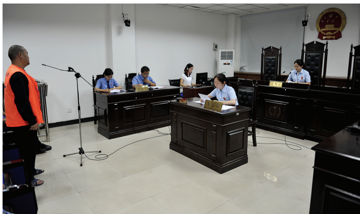
登封市检察院对涉嫌危险驾驶罪者提起公诉

“我们必须清醒地认识到醉驾给我们带来的事故隐患和生命、财产隐患,从而自觉抵制醉驾行为。”100%的醉驾者都承认,自己之所以醉酒驾车,就是因为心存侥幸,岂不知,一个侥幸便是对法律的不尊重、不在乎,不尊重法律一定不会遵守法律,不遵守法律,势必导致随意违法,势必受到法律的制裁。因为只有你认真地对待它,它才会保护你,反之,它就会惩罚你。要管住自己的嘴,不要喝太多,管住自己的手和脚,不要醉酒驾车。一念天堂一念地狱,如果恣意妄为,醉驾入罪,下一个,可能就是你。