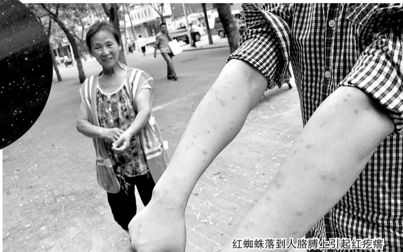
红蜘蛛落到人胳膊上引起红疙瘩