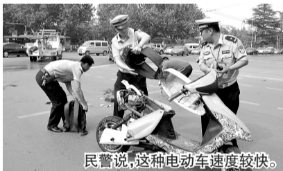
民警说, 这种电动车速度较快。

因为正处闹市区, 交警二大队民警一边勘查现场, 绕着少年用白色粉笔画上一个人形图。另一名民警拉开红色书包, 有几本书, 一套还没有做完的期末复习题。