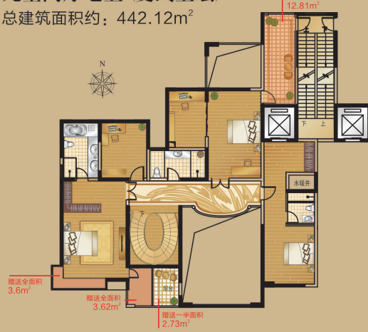
D-4 Residence Appreciation 九室两厅七卫(复式上层) 总建筑面积约：442.12m 2