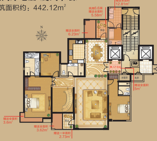
D-4 Residence Appreciation 九室两厅七卫(复式下层) 总建筑面积约：442.12m 2