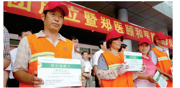
为1000名环卫工人免费体检。

为庆祝医院开诊和医疗集团成立,让更多群众受益,郑州人民医院颐和医院投资河南盛润控股集团有限公司向市慈善总会捐赠3000万元现金,用以成立的专项医疗救助基金,专门用于家庭贫困、长期遭受法洛四联症、三尖瓣缺损、房间隔缺损、室间隔缺损、动脉导管未闭、心脏瓣膜置换术、原发性乳腺癌、唇腭裂、先天性青光眼、先天性巨结肠、髋关节置换、先天性髋臼发育不良、多胎分娩、先天性隐睾、精索静脉曲张15种疑难病症患者的救治与医疗。