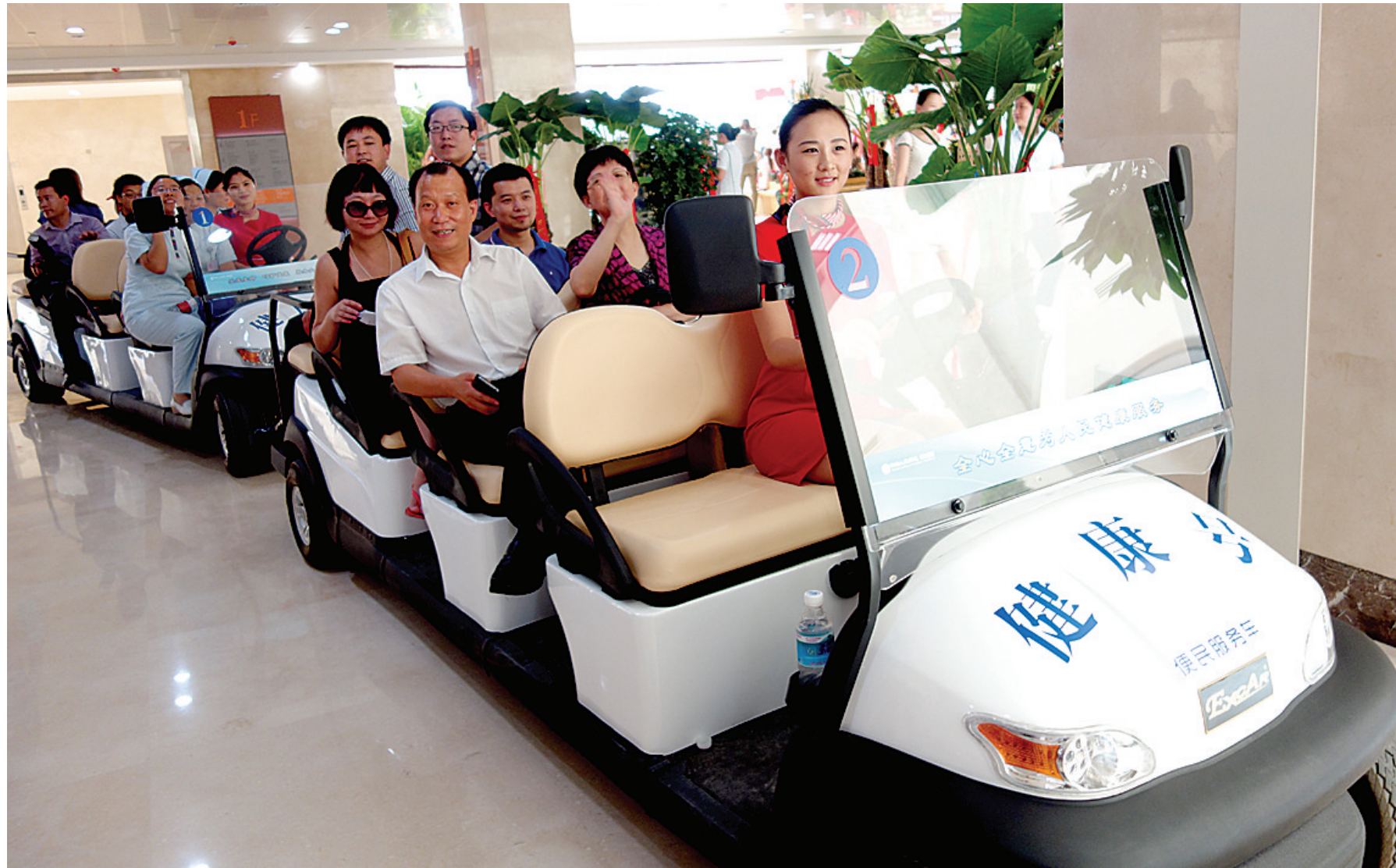
医院配备了电瓶车。

绿意葱茏的生态廊道、布置温馨的休闲书吧、货品齐全的超市、优雅洁净的餐厅……你相信这是置身一家医院吗?6月29日,一批体验者乘坐高档舒适的“健康号”、“颐和号”电瓶车,第一次穿过环境宜人、设施齐全的国内单体面积最大的非营利性综合医院——郑州人民医院颐和医院后,不由得惊叹不已,纷纷用手机拍下发微信、微博,与亲朋好友分享惊喜。当日上午,郑州人民医院颐和医院正式开诊,郑州人民医院医疗集团同时揭牌成立。这开创了本市医疗卫生办公助的先河,标志着本市公立医院体制改革迈出了坚实的一步,并取得了阶段性成果。和传统的医疗机构不同,这家用全新机制和理念打造的医院处处以人为本,亮点纷呈。