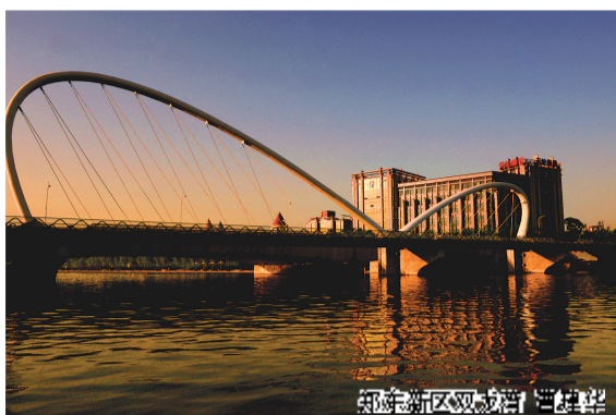
郑东新区观城台 张合聚

丽景千重何处觅？风光佳泽柳依依。 纵渠南北经层楼，横穿市井纬东西。 漾漾流润万户，河畔勃郁万木齐。 虹桥如霓随可见，清溪长波时弯曲。 花廊纤蕊暗飞香，林中闲鸟和鸣啼。 轻车曼道寻荻芦，察遍靓城无荒蹊。 胜地定有陶公在，专作桃花源中记。 鸢望具茨撒紫岚，知是轩辕佑华夷！