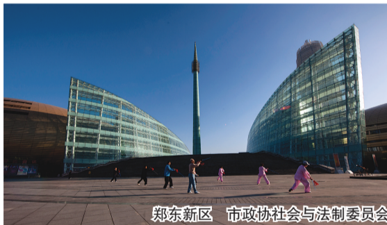
郑东新区 市政协社会与法制委员会