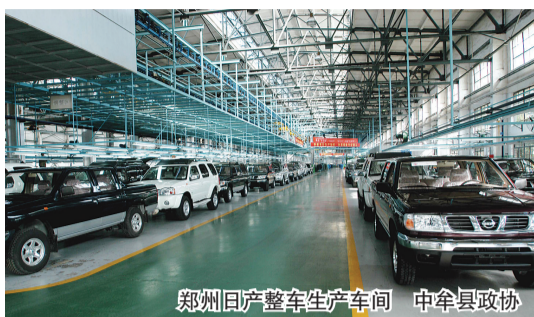
郑州日产整车生产车间 中牟县政协

改革开辟路径，引古城焕发富强梦。 凭三化协调，城乡发展；产业集聚，新区兴 盛。更有空港，巍然崛起，五洲从此任驰 骋。共努力，期华夏摇篮，腾飞金凤！