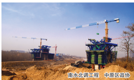
南水北调工程 中原区政协