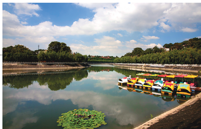
荜阳四库一河治理(索溪公园) 荜阳市政协