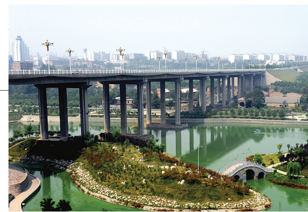
巩义市石河道生态公园靓丽的生态水系 曹克强