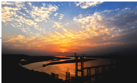
荥阳桃花峪黄河大桥夕阳 邓宝山