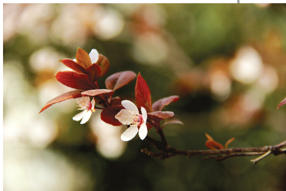
春 二七区福华街政协工委