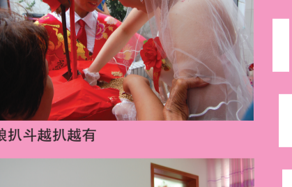
小姑为新娘端洗脸水接风