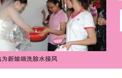
小姑为新娘端洗脸水接风