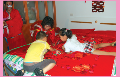
金童玉女压床寓意“儿女双全”