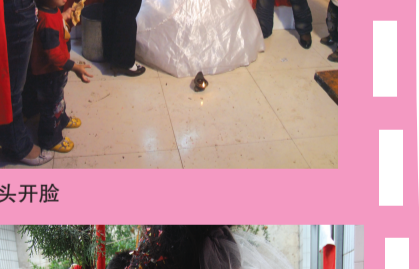
新娘扒斗越扒越有