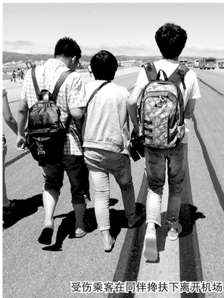
受伤乘客在同伴搀扶下离开机场