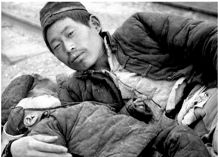
饥荒受灾者，父与子