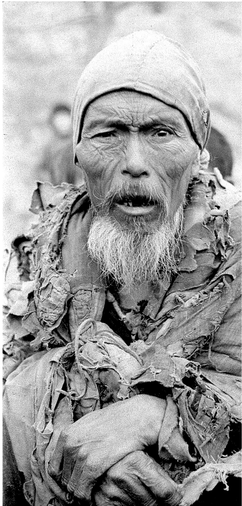
饥荒受灾者，衣衫褴褛