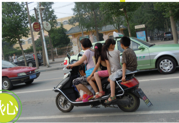
7月5日下午3时,在市滨河路,一辆电动车挤着一个大人和4个孩子。车速很快,即使路过红灯时也不减速。坐在最末端保险架上的小孩,不时地晃动身体,让人看着实在揪心。