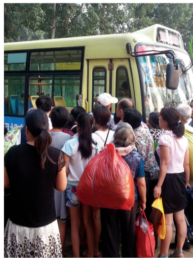
7月5日早晨,登封市东华镇河门村6路公交车终点站,第一班公交车刚停下,赶早集的菜农一拥而上。