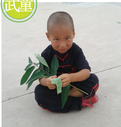
竹林慈幼院。一位刚练完武的儿童盘腿坐在地上玩耍。