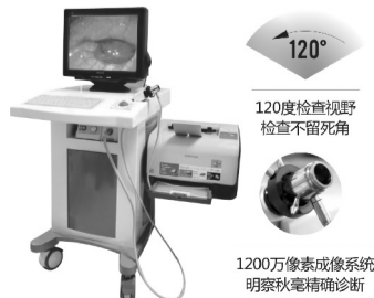
1200万像素成像系统 明察秋毫精确诊断