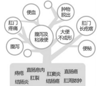
肛肠疾病种类繁多,症状相似类疾病

检查外,还需根据患者年龄,便血的方式、多少、颜色及是否伴有疼痛等症状综合分析诊断,才能确诊。所以,在首次出现便血时,就应该及时到医院诊治,以免耽误病情,引发癌变。