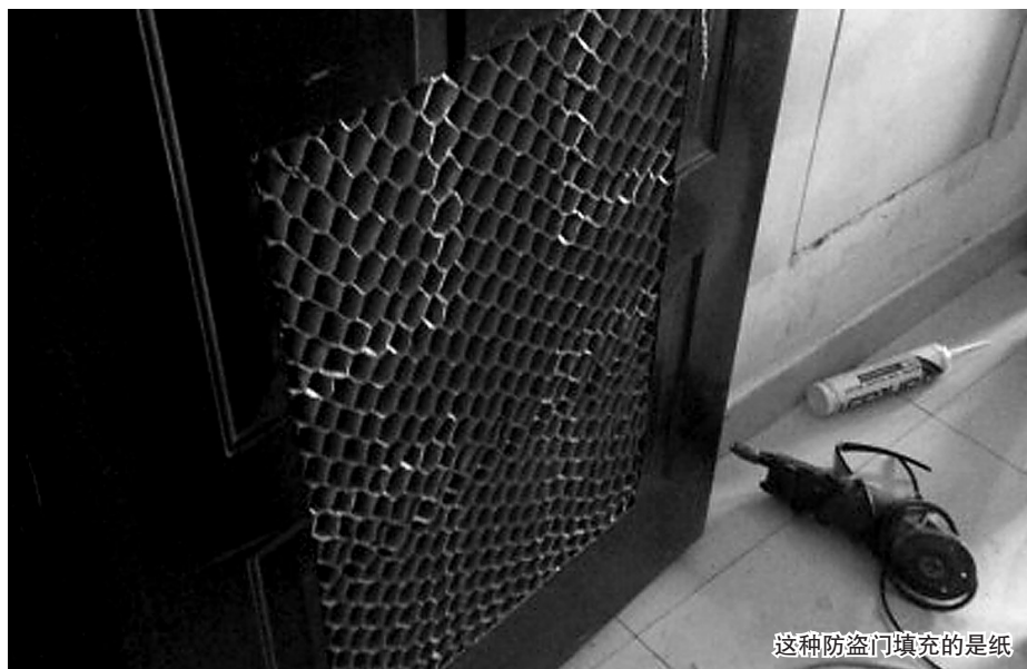
这种防盗门填充的是纸