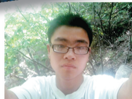
时彤 母校,成长路上,感谢有您;母校,感恩的心,感谢有您。