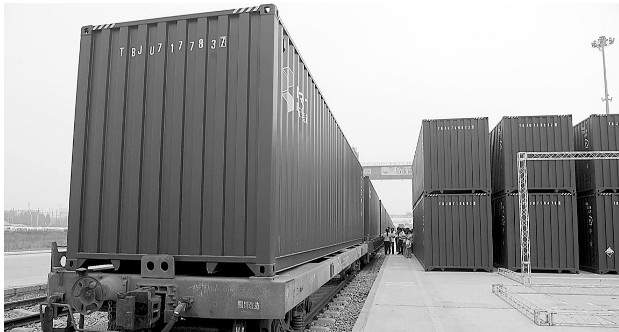
昨日，媒体记者在郑州铁路集装箱中心站参观，现场了解即将运往欧洲的集装箱。