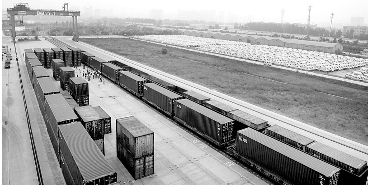
郑州铁路集装箱中心站，准备运往欧洲的集装箱整装待发。

作为中国第一个上升为国家战略的航空港经济发展先行区，郑州航空港经济综合实验区提出建设“大枢纽”、“大产业”、“大都市”的总体格局。