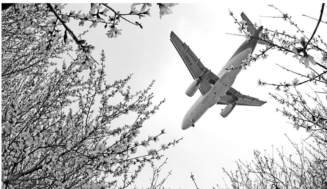
一架飞机从航空港实验区起飞。郑欧班列的开通对航空港实验区的建设意义重大。

今日,一列满载货物的国际班列从郑州集装箱中心站开出,约15天后,班列将直达德国汉堡。这标志着从郑州出发穿越亚欧大陆桥的郑州至欧洲的铁路国际货运班列正式开通。