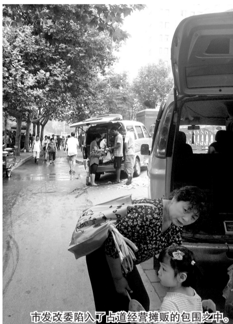
市发改委陷入了占道经营摊贩的包围之中。

网友“无聊的熊猫”：“很多社区都设有固定的西瓜销售点,我们小区里面就有一个,但是这些固定销售点现在都成了摆设,连搭的棚都破了。瓜农卖瓜赚钱也不容易,希望社区工作人员能发挥作用,既要保证瓜农卖瓜,还得保证正常的道路通行啊。”