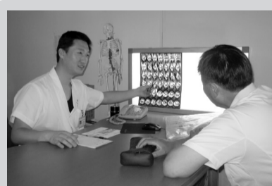
鹿主任给患者讲解病情