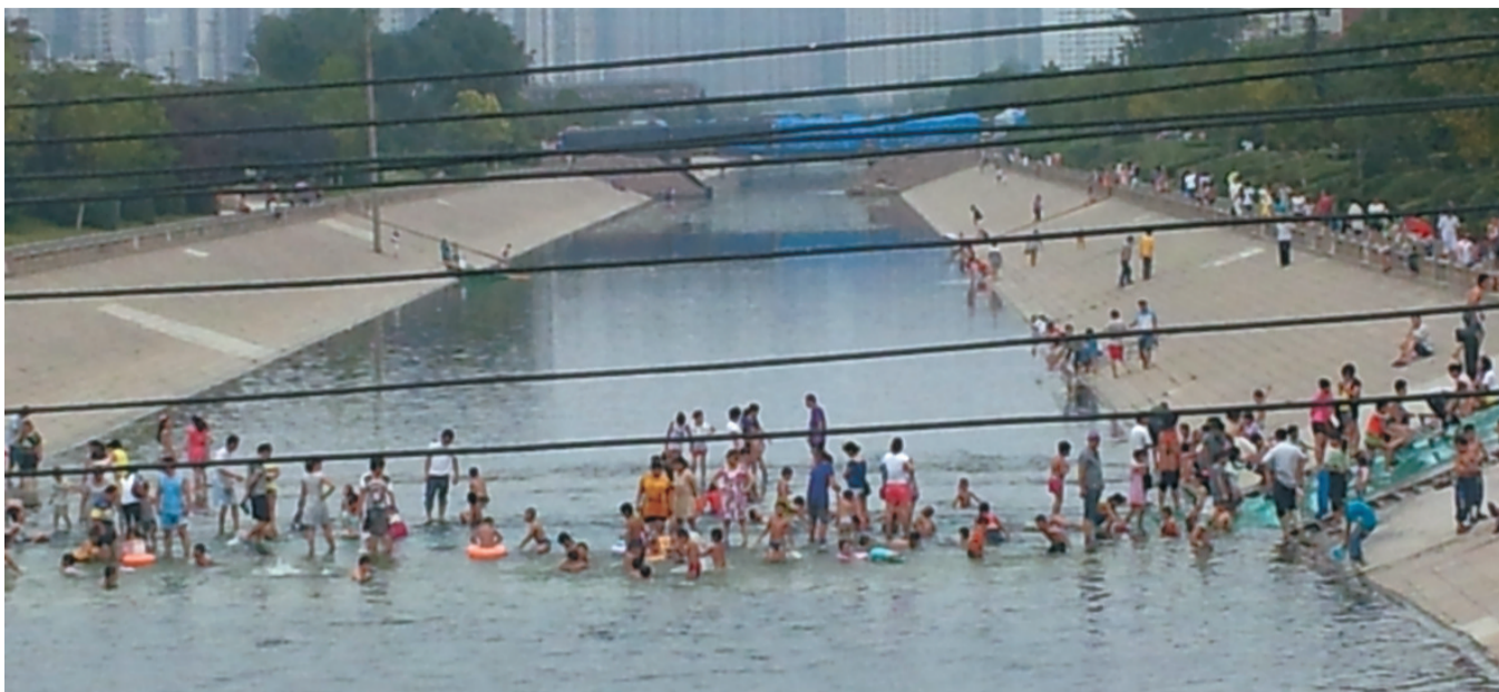
东风渠国基路口很多人涉水寻凉

远离了学校的束缚和学习考试的压力,在这个漫长的暑假,最“嗨皮”的莫过于孩子们。准备好球拍、滑冰鞋或者游泳衣,痛痛快快地玩上一个夏天。可这对于家长来说,这两个月就不那么轻松了。没放暑假的时候,孩子往幼儿园或学校一送,踏踏实实地上班去了。孩子不上学就多了几件操心的事:白天上班,孩子一个人在家跑出去玩下水游泳或遇到交通事故怎么办?摔伤、磕伤怎么办,遇到坏人怎么办……总之,一到暑假,孩子的安全就成了家长最挂心的事。爱孩子,就先教他如何远离危险吧!