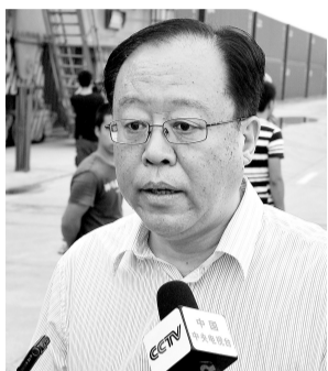
郑州市委副书记、市长 马懿