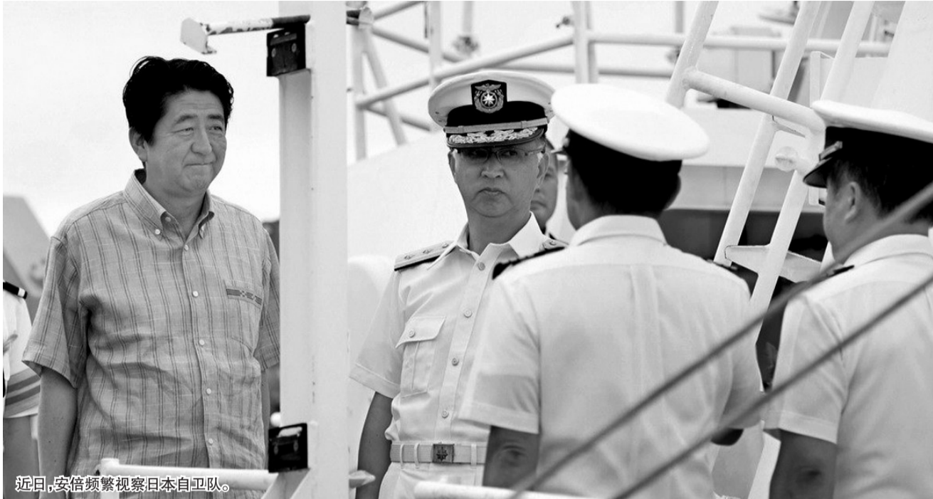
近日,安倍频繁视察日本自卫队。