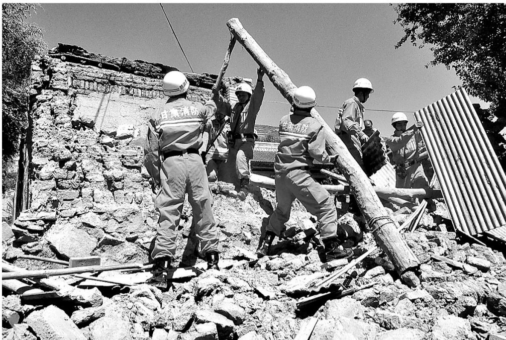
定西市消防队迅速赶到灾区救援