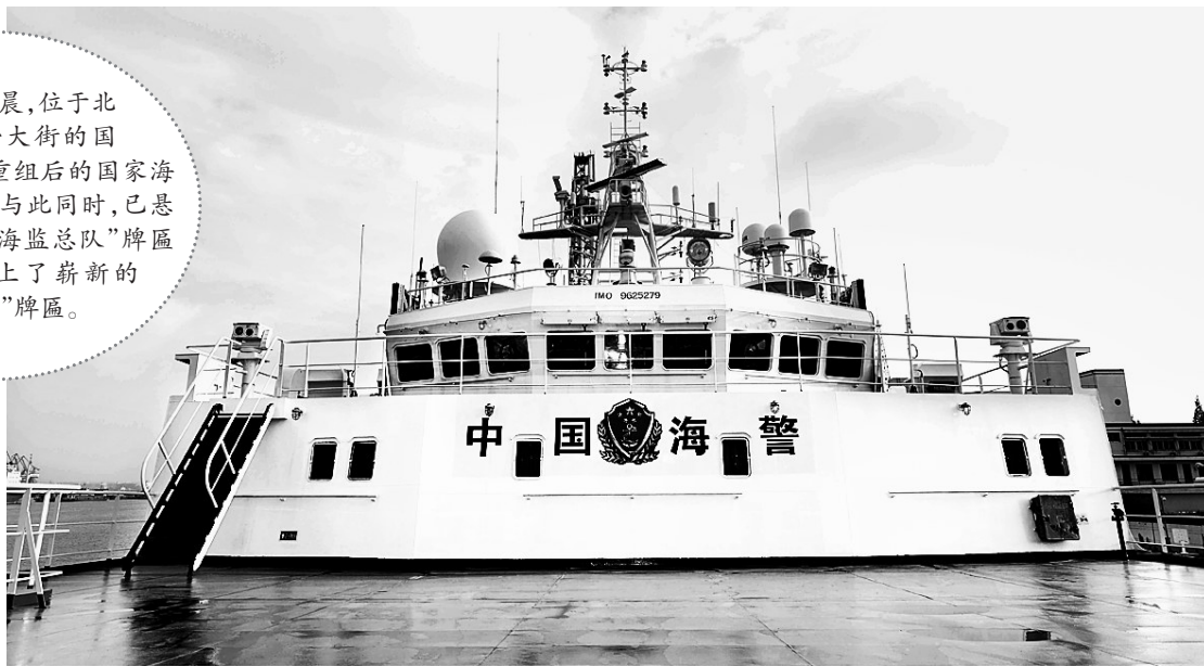
7月22日，中国海警2350船即将启程执行维权巡航任务。

22日清晨，位于北京复兴门外大街的国家海洋局门口，重组后的国家海洋局正式挂牌。与此同时，已悬挂14年的“中国海监总队”牌匾被取下，换上了崭新的“中国海警局”牌匾。