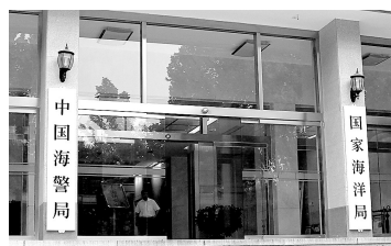
7月22日清晨，国家海洋局、中国海警局挂牌