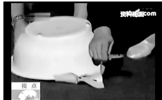
第六步:从盆子边沿爬出了蛇。