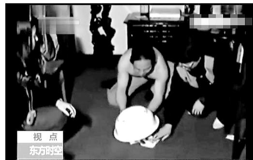
第五步:揭开盆子,露出边沿。