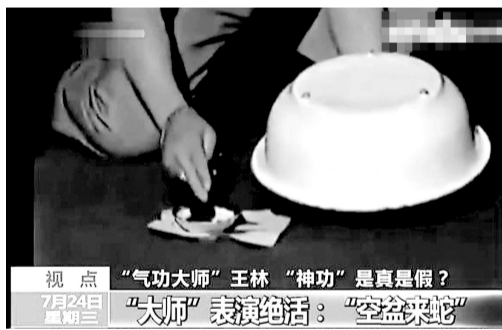
第二步:小碗内烧纸,然后准备扣上盆。