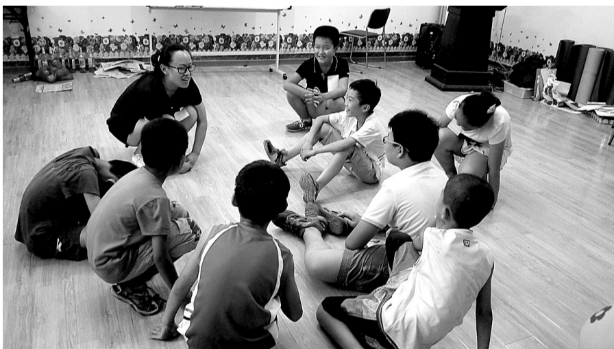
孩子们在老师的带领下做游戏。

从夏令营活动第一天开始,孩子们每天玩的都不一样。第一天是破冰之旅,孩子们相互熟悉;第二天做沙盘,可以发现孩子们不同的性格特点;最近这两天是不断地玩团队游戏。