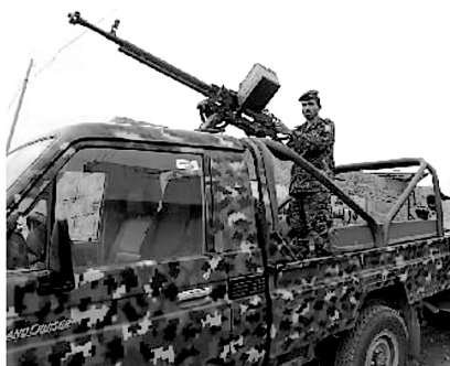
杀死美驻也门大使赏3公斤黄金

如今,“基地”组织阿拉伯半岛分支发出的死亡威胁令美国尤其重视。美国驻也门大使馆已经由也门政府军用了最高级别的安保措施,多层路障不说,自大使馆外围两个街区便开始层层布防,未经特别许可严禁靠近!