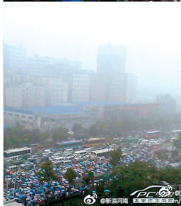
每逢雨天这里都挤成这样