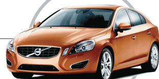
沃尔沃S60 提到行车安全肯定不能少了沃尔沃,这个以安全著称的品牌早已深入人心,而主打的City Safety城市安全系统相信大家也早已不陌生。