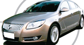
别克君威 2.0T 旗舰运动版 目前市面上的君威2.0T集缸内直喷、涡轮增压技术于一身。不光如此,君威的涡轮增压器采用了双流道技术,这对于发动机性能的提升起到了关键作用。