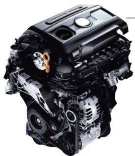
涡轮增压发动机与自然吸气发动机相比,在结构上最大的区别就是增加了涡轮室和增压器。

如今的汽车不仅成为时尚的载体,更成为高科技的载体。我们从汽车上接触到的最新尖端科技可谓数不胜数,从提出新概念到在汽车上应用,速度越来越快,令人目不暇接。当涡轮增压、人机交互等高科技已经不再神秘,6速手自一体、5AR-FE双VVT-i发动机不再是高精尖,而全身从前到后多个摄像头的设置,毫米雷达盲区检测、预防碰撞等高科技正在走向汽车技术的流行前沿。郑州晚报记者 谢宽