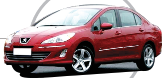
标致408 拥有“广域超尺寸空间”设计理念的最新力作,时尚大气的车身造型,360度宽敞舒适的空间,全方位清晰无界的视野。