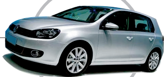
高尔夫6 1.4TSI+DSG自动豪华型 说实话,高尔夫6能够取得如今这样骄人的成绩,我对此一点也不奇怪。在国外,是因为它经济、运动、有历史,而在国内,是因为它技术领先。