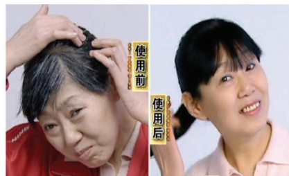
“惊! 白发变黑发,让我年轻20岁”