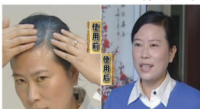
“怪! 白头没有了,比中500万还高兴”