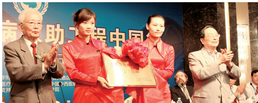
肛肠救助活动现场

据悉,由卫生部支持发起的“全国肛肠疾病救助工程”开展以来,已初步实现“肛肠病诊疗救助”全覆盖,价值160元的彩色超导光电子肛肠镜检查费,由“全国肛肠疾病救助工程”埋单,至今已为2.3万例便血、肛门疼痛及肿物脱出患者排除肛肠癌变风险。