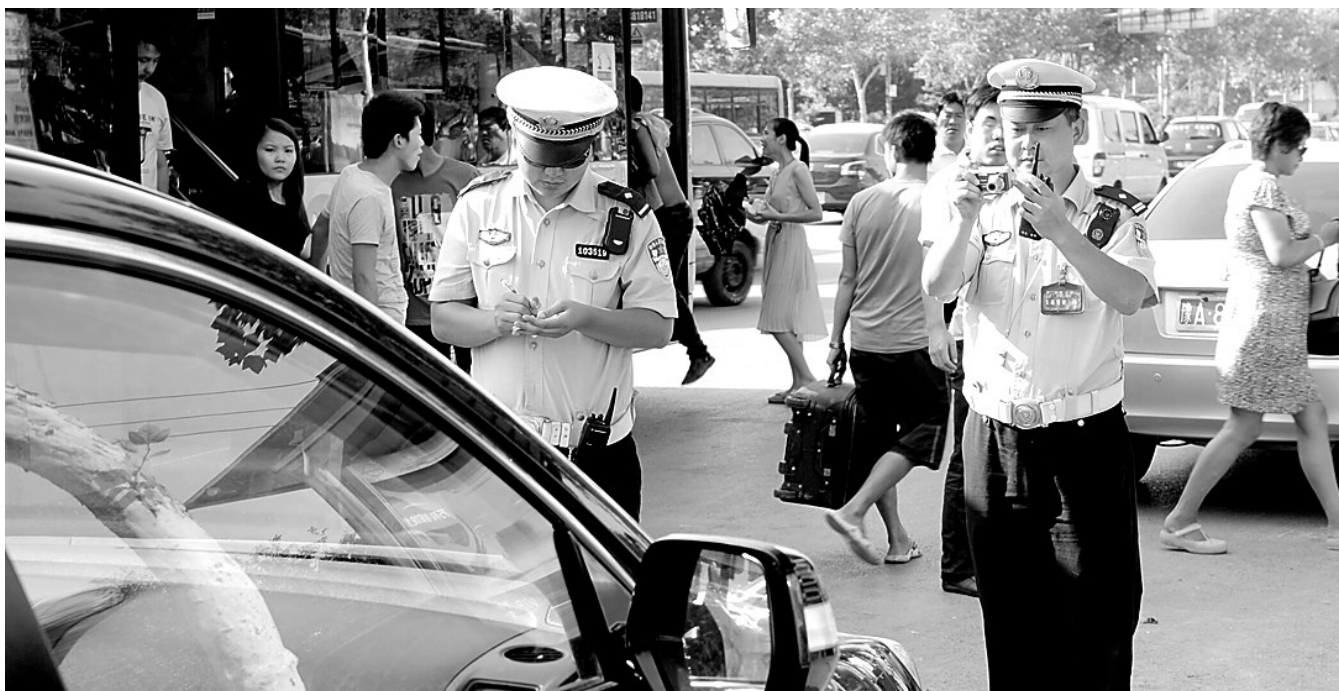
昨日下午,交巡警五大队民警在花园路刘庄公交站旁对违停车辆进行拍照取证后处罚。