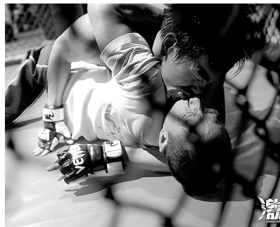
彭于晏“强吻”张家辉。

自的那一点不夺目却又极有人情味和励志感的心理诉求,能够引起观众不少共鸣。最重要的是,这种生猛的流血的打戏在以上各点综合调剂下,不仅不会引发女性观众的反感,反而提起她们的兴趣。