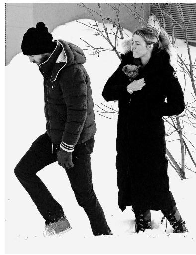
他们婚后生活很低调。