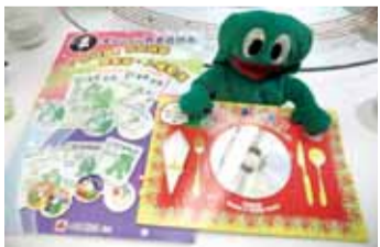
莫妈妈出品的英文教科书(上)；莫爸爸出品的家传汤谱(左)。

温馨提示：因材料昂贵，此汤可“翻煲”再煮一次，切勿暴殄天物。莫爸爸表示，冬虫草比黄金还贵，若经济条件不允许，可以只煲“石斛+西洋参”：“很多人以为冬虫草吃得多吃就会好，其实并不是这样的，只要吃两三条冬虫草，就已经能很好地发挥其功效。”