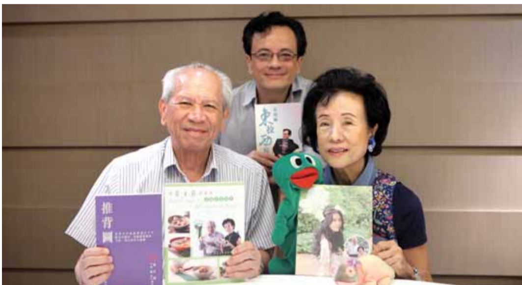
在一家传统的香港茶楼里，莫家“一门三杰”合影。