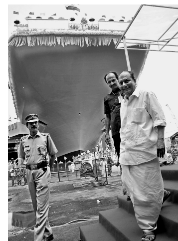
印国防部长安东尼(右)参加仪式。

不过,对于一些媒体炒作印度开发先进武器是针对中国,中国官方一直不为所动。事实上,对于印度开发先进武器,中国很少发表强硬表态。去年印度成功试射远程导弹后,中国外交部的表态是,中印不是竞争对手,而是合作伙伴。