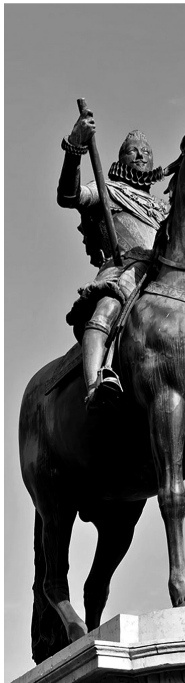
马德里马约尔广场骑马雕像