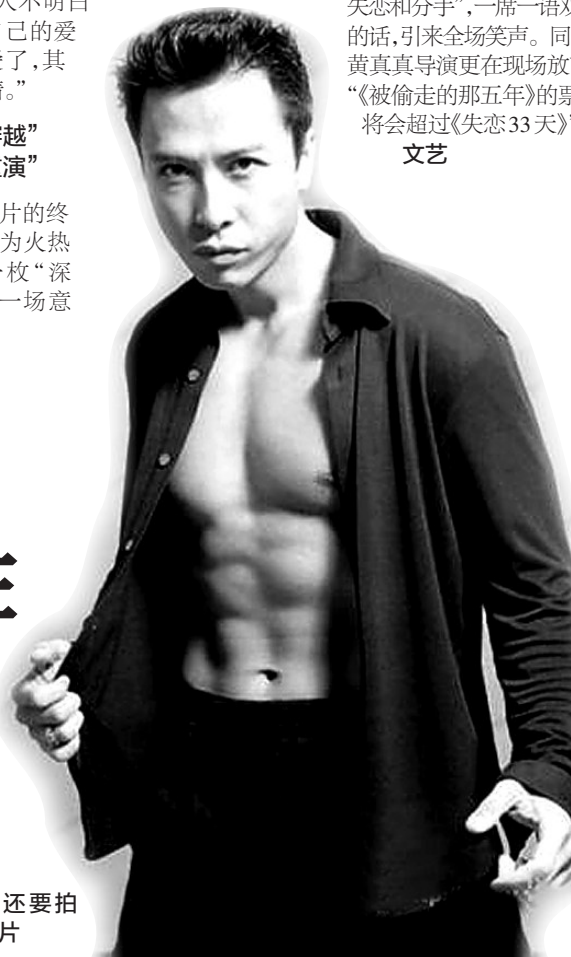
甄子丹称还要拍 10年动作片

发布会上,对于自己的角色白百何分析说,“我的角色几乎有现在都市女性的通病,比如事业压力、忽视生活,但是她对爱情却是渴望的,可是她不知道如何把握爱情,把猜疑和争吵当做处理的方式,最后只能分手。我觉得这部戏特别适合女人带着男朋友或者老公来看,一起回味自己爱情生活的点点滴滴。”在现场,白百何更调侃称,“情侣一定记得来看哦,因为这部爱情电影有特效,专治失恋和分手”,一席一语双关的话,引来全场笑声。同时,黄真真导演更在现场放言:“《被偷走的那五年》的票房将会超过《失恋33天》”。 文艺