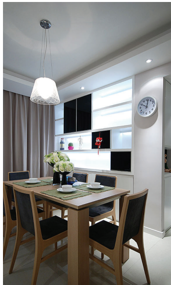
清爽风格,让人食欲大振。