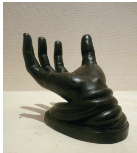
样式各异的饰品,总能给心里传递一丝清凉。