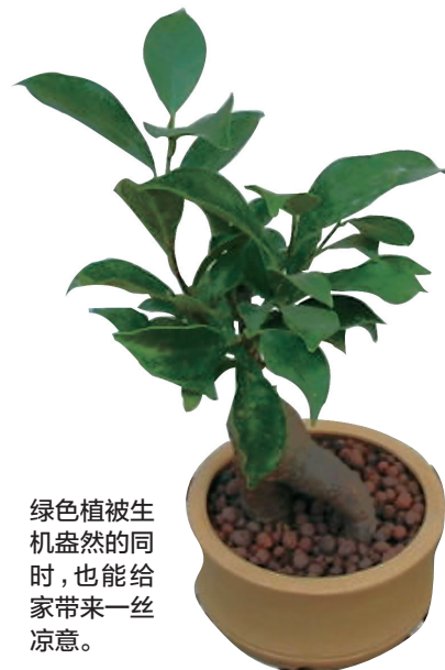
绿色植被生机勃勃的同时,也能给家带来一丝凉意。