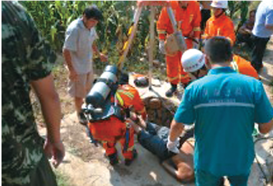
“120”和“119”工作人员正在对老人进行施救

“你们快来吧,我叔掉井里啦。”8月14日上午9时,登封市消防大队接到登封市110指挥中心指令:登封市中岳区康村7组一六旬老汉为捞一只桶失足掉入井中。事发后,登封消防迅速赶赴现场营救打捞出老人,但不幸老人溺水时间过长,已无生命迹象。事发时,在旁边地里劳作的侄子