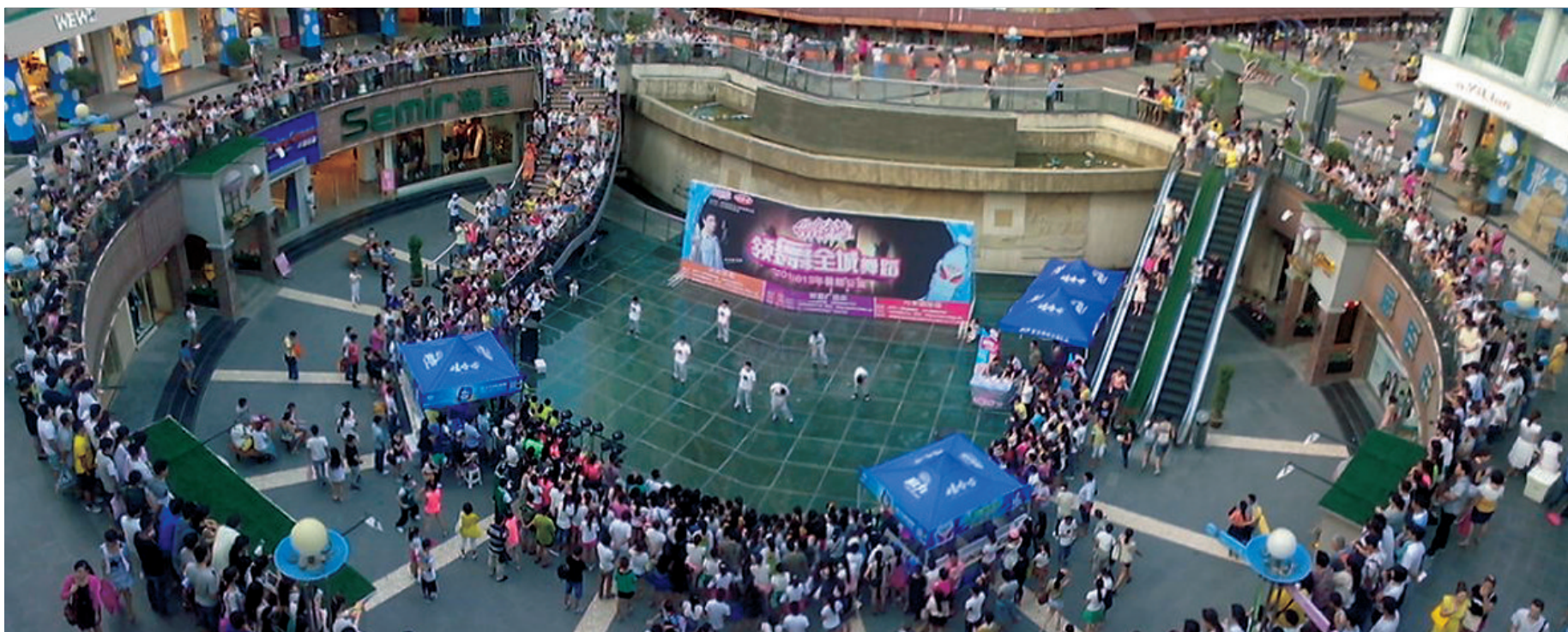
潮流派对暑期公演