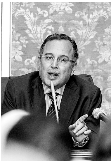
8月18日,埃及外长法赫米召开新闻发布会,介绍目前埃及国内形势及外交政策。

埃及临时政府18日举行内阁会议,讨论是否解散穆斯林兄弟会等议题。当天,支持遭解职总统穆罕默德·穆尔西的团体再次呼吁举行示威。同日,埃及外交部长法赫米说,在国际社会对埃及进行强烈谴责、施压甚至可能插手埃及内部事务的情况下,埃及正在重新审视来自国际社会的援助是否有益。