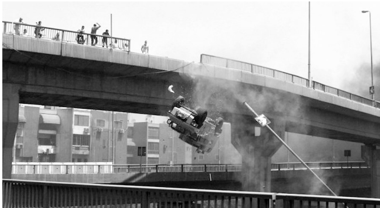
持续的冲突中,示威者将载满警察的警车推下桥。

埃及北西奈省两辆运送警察的汽车19日遭到武装分子袭击,造成至少25名警察死亡,3名警察受伤。