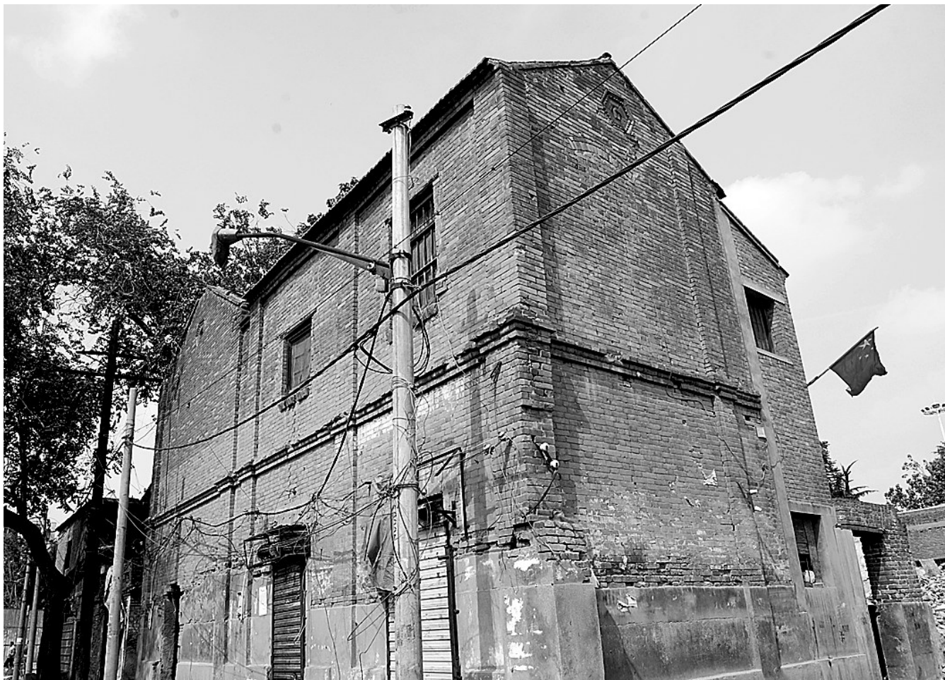
南乾元街75号院建于民国初期，至今已有百年历史。