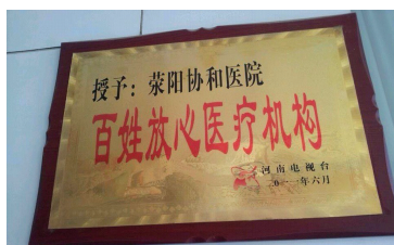
一个荣誉证书,就是患者的一次次褒奖