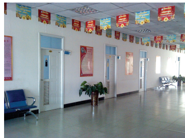
温馨的就医环境,让患者有家一样的感觉