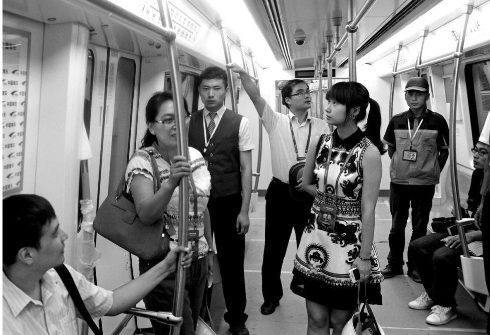
代表在体验运行的地铁。

郑州市地铁票价听证会即将于9月6日召开,听证会消费者代表和旁听人员要提前对地铁运营情况进行近距离了解。昨日,郑州市物价局组织部分听证会消费者代表和旁听人员乘坐正在调试的地铁列车,并走进车站了解地铁的联调联试等情况。本报记者也跟随体验了一把动起来的郑州地铁,从农业南路站坐到体育中心站,6公里。 郑州晚报记者 李萌/文