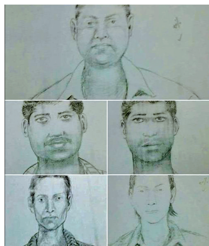
警方公布了5名嫌疑人的素描像

印度孟买发生女记者遭轮暴案,妇女不安全老问题再遭各界挞伐。强大压力下,警方在案发约18小时后,8月23日中午宣布破案,涉案5嫌疑犯身份经确认后已全遭逮捕。