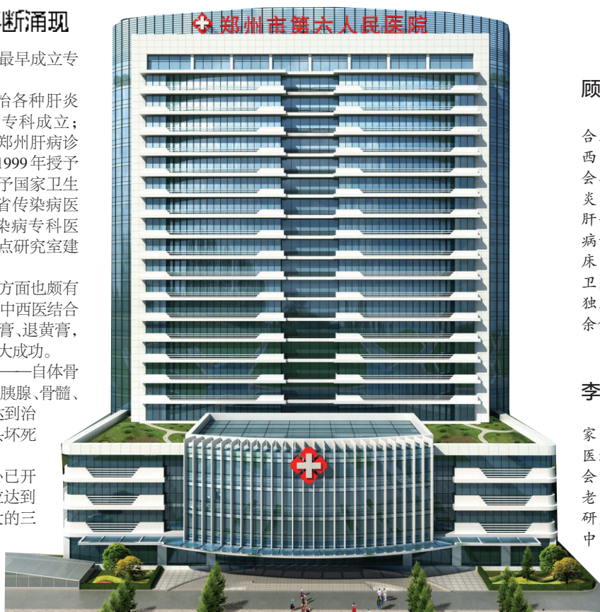
市六院肝病医学中心大楼效果图

如今,投资1.96亿元的肝病医学中心已开始施工,该中心设置床位500张、编制床位达到1100张,预计建成后将成为我省规模最大的三级传染病综合医院。院长许金生表示,在历史的新起点,在履行好公共卫生职能的同时,河南省传染病医院将勇挑河南省传染病防治事业的大梁,为促进社会和谐稳定作出积极贡献。